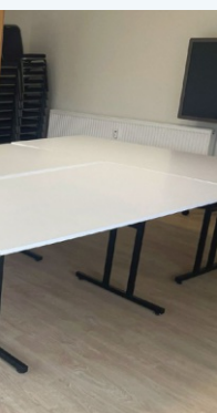
s des TV-Clubhauses wurde komplett renoviert. Auch die Toilettenanlage hat dem Raum

Die cbs Corporate Business Solutions ist ein international tätiges Beratungsunternehmen mit Hauptsitz in Heidelberg, das Unternehmen weltweit bei der digitalen Transformation begleitet. Neben dieser starken Ausrichtung auf die Wirtschaft übernimmt cbs auch gesellschaftliche Verantwortung: Mit der Spendenlotterie wurde ein Format geschaffen, das gezielt kleinere Organisationen, Vereine und Initiativen unterstützt.