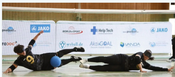
Gemeinsam mit dem BSS Ilvesheim und Goalball Deutschland durfte der TV 1864 Gastgeber eines Bundesligaspieltags im Goalball sein. Diese paralympische Sportart für sehbehinderte Menschen hat nicht nur sportlich, sondern auch menschlich tief beeindruckt.