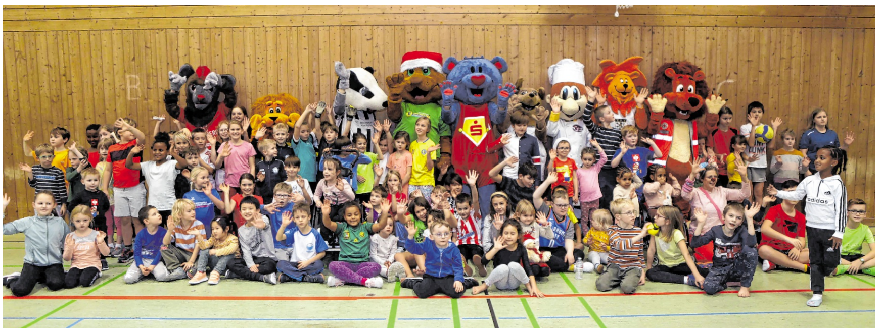
Der „Open Sporty Sunday“ – hier ein Gruppenfoto aus dem Jahr 2025 – ist nach wie vor ein Leuchtturmprojekt des Turnvereins.