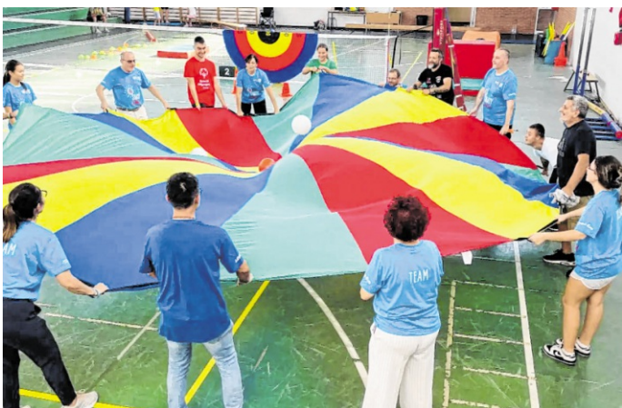
Städtepartnerschaftliches und inklusives Sporttreiben.