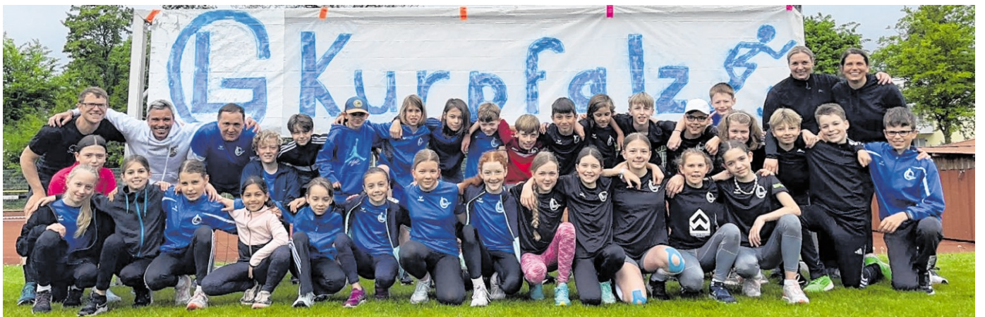
Ein erstes Highlight war in den Osterferien das Trainingslager der U12 und U14 in Bad Bergzabern