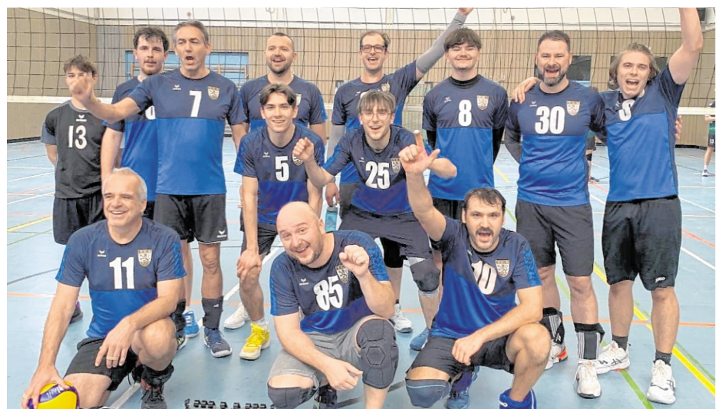
Die zweite Herrenmannschaft wurde ebenfalls Meister.