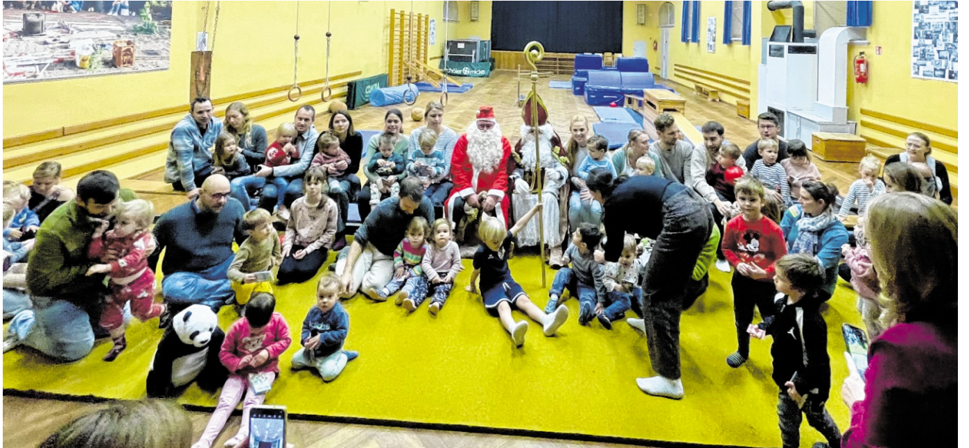
Die Nikoläuse waren auch bei den Purzeltornern in der Lore-Eichhorn-Halle zu Besuch.

Dank der Spenden der Vereinigten VR Bank Kur- und Rheinpfalz (1000 Euro), der Stadtwerke Schwetzingen (500 Euro), der Sparkasse Heidelberg (250 Euro) und der Schwetzingener Firma Moll (200 Euro) sowie dem Erlös des TV-Volleyball-Nikolausturniers (700 Euro) konnten die kostenintensiven Neuanschaffungen von Ausrüstungsgegenständen sowie ein Dankeschön-Abend für die ehrenamtlich wirkenden Mitglieder der Gruppe komplett finanziert werden – weitere Spenden sind in Aussicht. Denn schließlich müssen Nikolaus- und Knecht-Ruprecht-Kostüme genauso wie Glo-