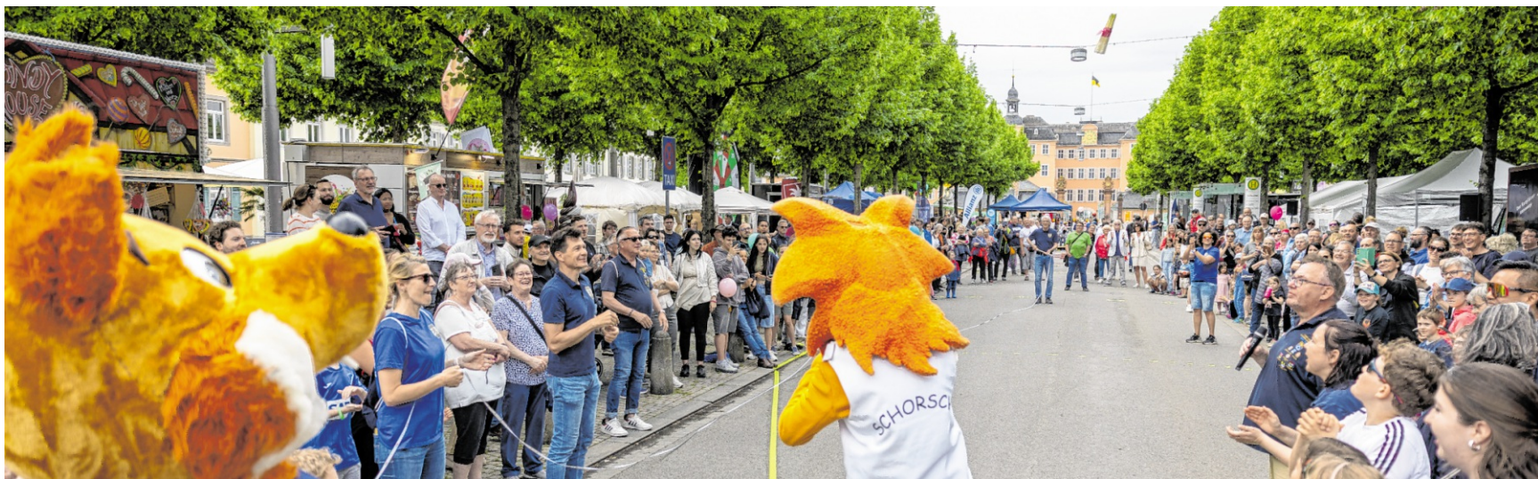
Maskottchen Schorsch machte eine gute Figur beim Spargelweitwurf.