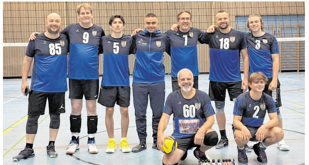
Die erste Herrenmannschaft stieg in die Landesliga auf.

Ergänzend treiben wir den Aufbau weiterer Jugendmannschaften ab der U14 konsequent voran und erweitern kontinuierlich unser Trainer- und Übungsleiterteam. So schaffen wir nachhaltige Strukturen für eine erfolgreiche Zukunft des Volleyballs in Schwetzingen. cn