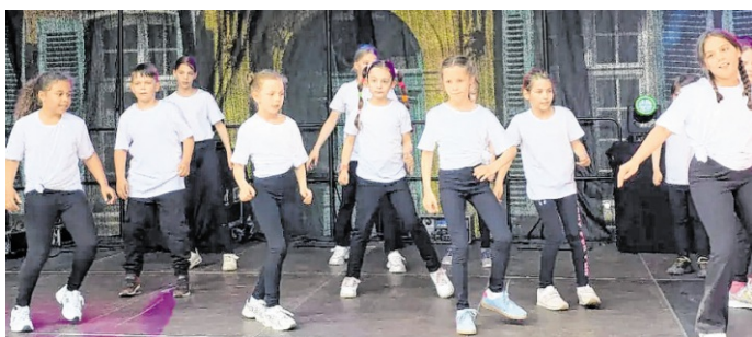
Die älteren Tänzerinnen und Tänzer zeigten eine gute Show.