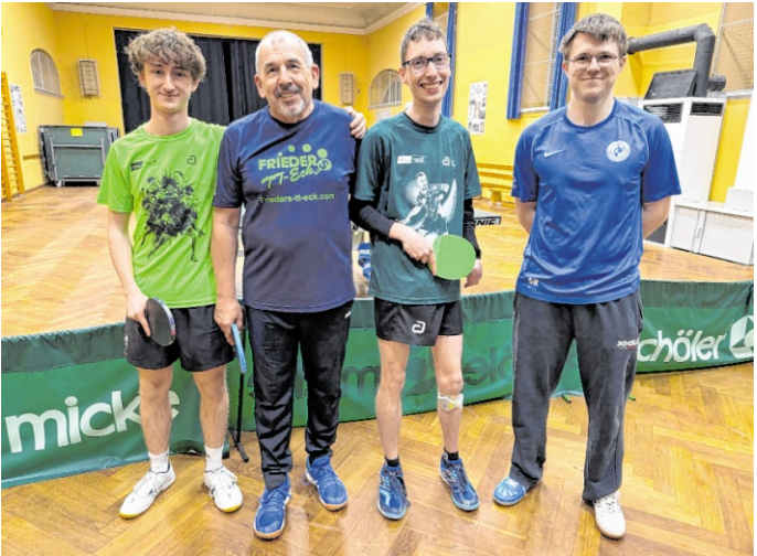
Der TV baut aktuell eine Para-Tischtennisgruppe auf.