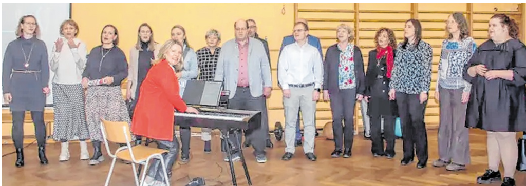
Die „SchwetSingers“ vom Sängerbund sorgen für musikalische Unterhaltung