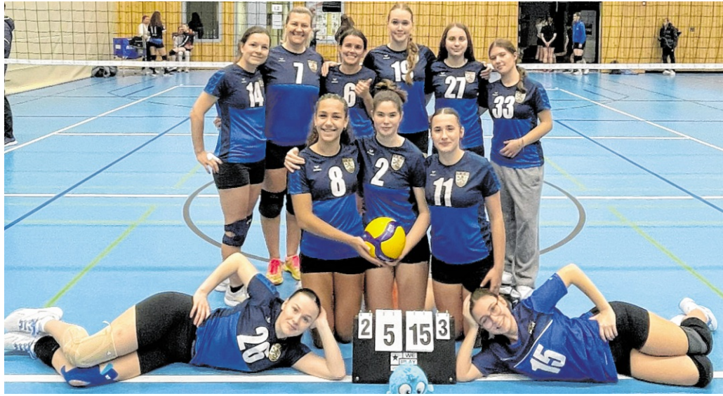
Die neu gegründete Damenmannschaft holte sich gleich den Titel.

Angespornt durch die Erfolge der ersten Mannschaft startete die „Zweite“ furios in die neue Saison und belegt zur Halbzeit verdient den ersten Tabellenplatz. Ein besonderes Highlight ist der Einstieg der neu gegründeten Damenmannschaft, den „Angry Brs“. In ihrer ersten Saison in der Kreisliga überzeugte das Team mit überragenden