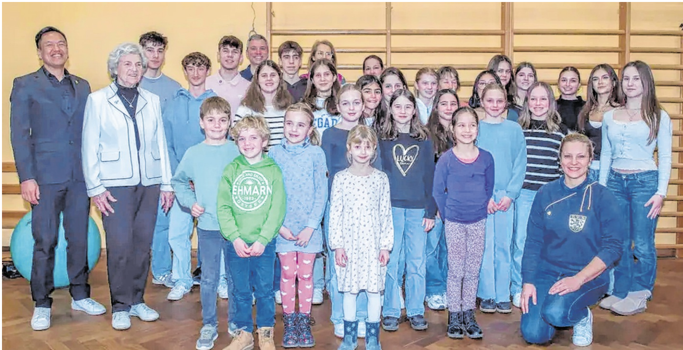
Die geehrten Sportlerinnen und Sportler bei der Neujahrsmatinee.

Ein überregional viel gepriesenes Projekt ist der im Oktober 2021 initiierte „Open Sporty Sunday“, ein monatlich stattfindender, kostenfreier inklusiver und integrativer Sportnachmittag des TV für Kinder von sechs – oder auch jünger – bis zwölf Jahre. Da treffen sich Kinder mit und ohne Handicap und egal, woher sie kommen, zu Sport, Spiel und Spannung. Das Coaches-Team umfasst inzwischen