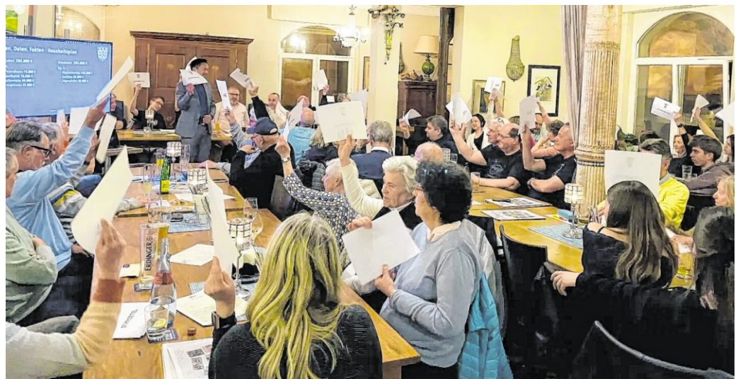
Erstmals fand die Mitgliederversammlung im „Blaues Loch“ statt. Die Resonanz zeigte, dass die Entscheidung richtig war.