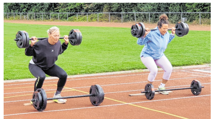
„Schorsch's Fitmix“ ist das neue Angebot beim TV.