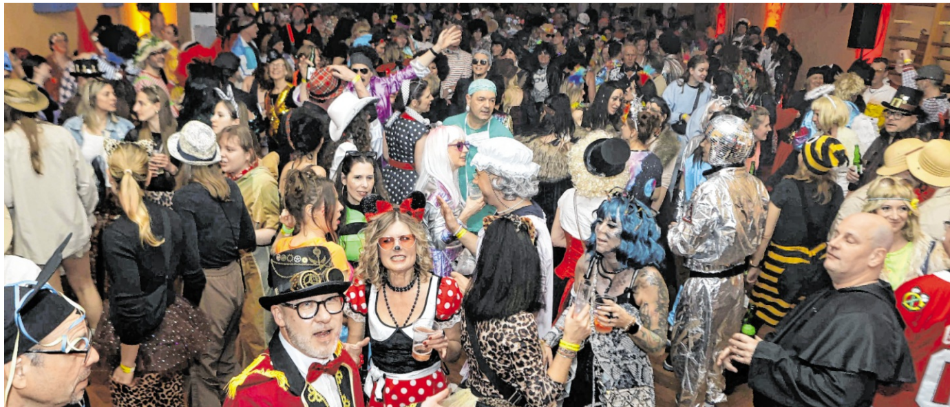
Bunte Kostüme, gut gelaunte Gäste und ausgelassene Stimmung waren auch bei „Pep & Pop reloaded“ 2025 Trumpf.

Schon früh schlängelte sich die erste Polonaise durch die Lore-Eichhorn-Halle, wie die altehrwürdige Heimstätte des Turnvereins im ehemaligen kurfürstlichen Marstall seit einigen Jahren heißt.