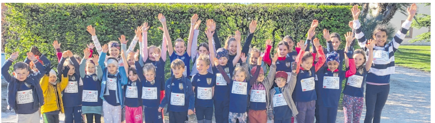
Mit einem großen Team waren die kleinen Leichtathleten beim Spargellauf dabei.