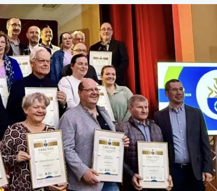
res Jubiläum gefeiert: 50 Jahre Interessengemeinschaft. In der festlich geschmückten Lore-Eichhorn-Gasse, was die IG für die Stadt bedeutet. Auch ein Mitglied zu dieser starken Gemeinschaft. Die IG Engagement ausgezeichnet.

Die Mitglieder können mit jedem Einkauf bei Embach den Verein unterstützen. Denn 1 Prozent des Einkaufswerts wird direkt an den TV Schwetzingen gutgeschrieben. Holt euch eure Vereinskarte in unserer Geschäftsstelle ab. Zeigt sie beim Einkauf bei Edeka Embach vor. Mit jedem Einkauf sammelt ihr automatisch für unseren Verein. Macht mit und unterstützt unseren Verein durch euren Einkauf. Die Aktion läuft ein Jahr.