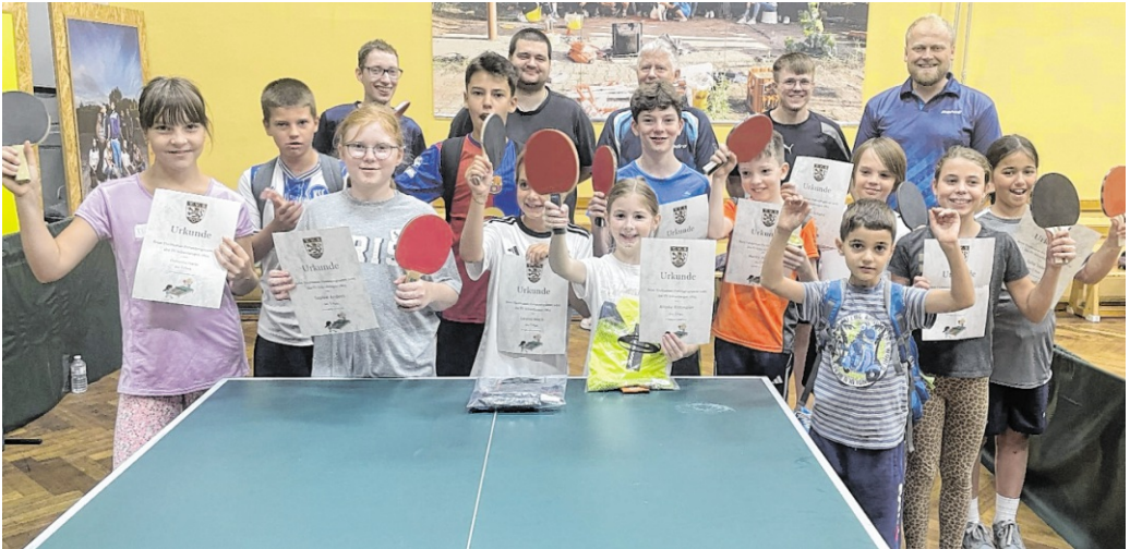
Beim Ferienprogramm der Tischtennis-Abteilung waren viele Kinder dabei.