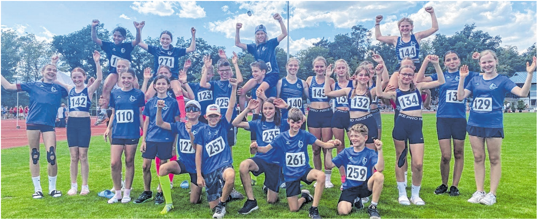
Zusammen mit den anderen Athletinnen und Athleten waren die TV-Asse bei den Kreismeisterschaften am Start.