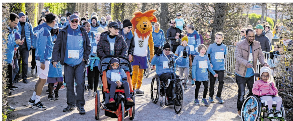
Das „Open Sporty Sunday“-Team nahm mit Maskottchen „Schorsch“ am Schülerlauf teil.