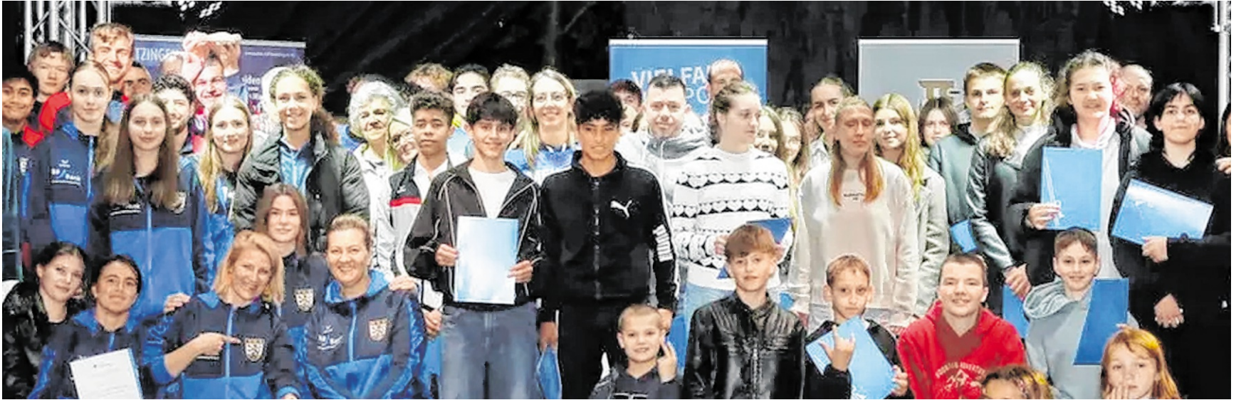
Die Geehrten bei der Sportlerehrung der Stadt.