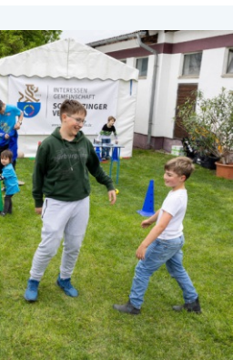
ch der Stadt Schwetzingen der TV 1864 mit einer „Open Sporty Sunday“ r super.