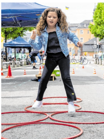
Beim TV konnten Kinder allerlei Sportliches ausprobieren.