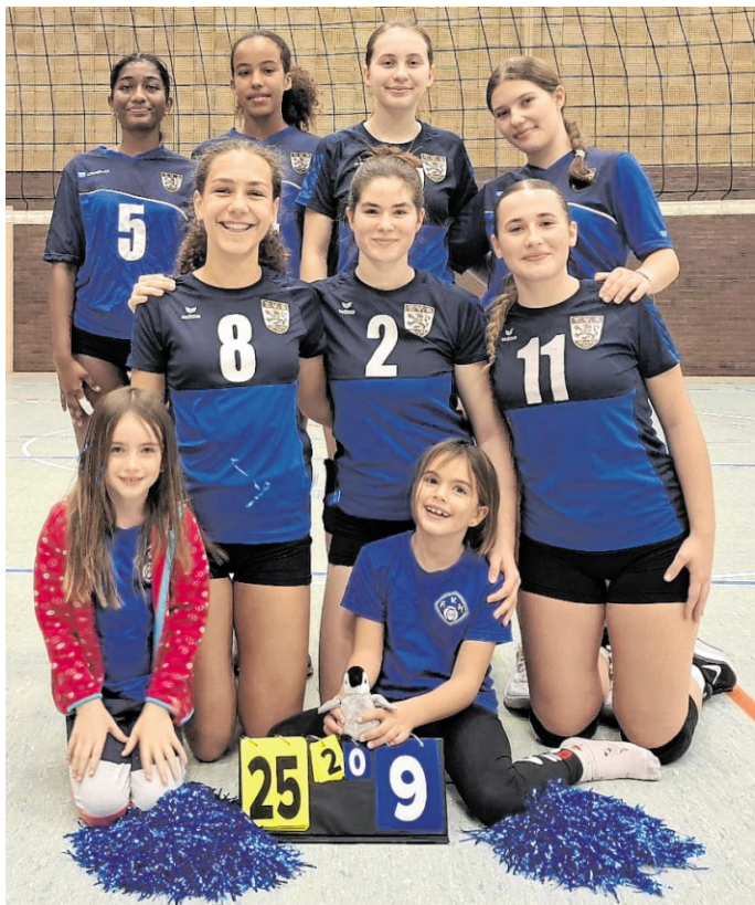
Die Jugend ist der ganze Stolz der Abteilung.