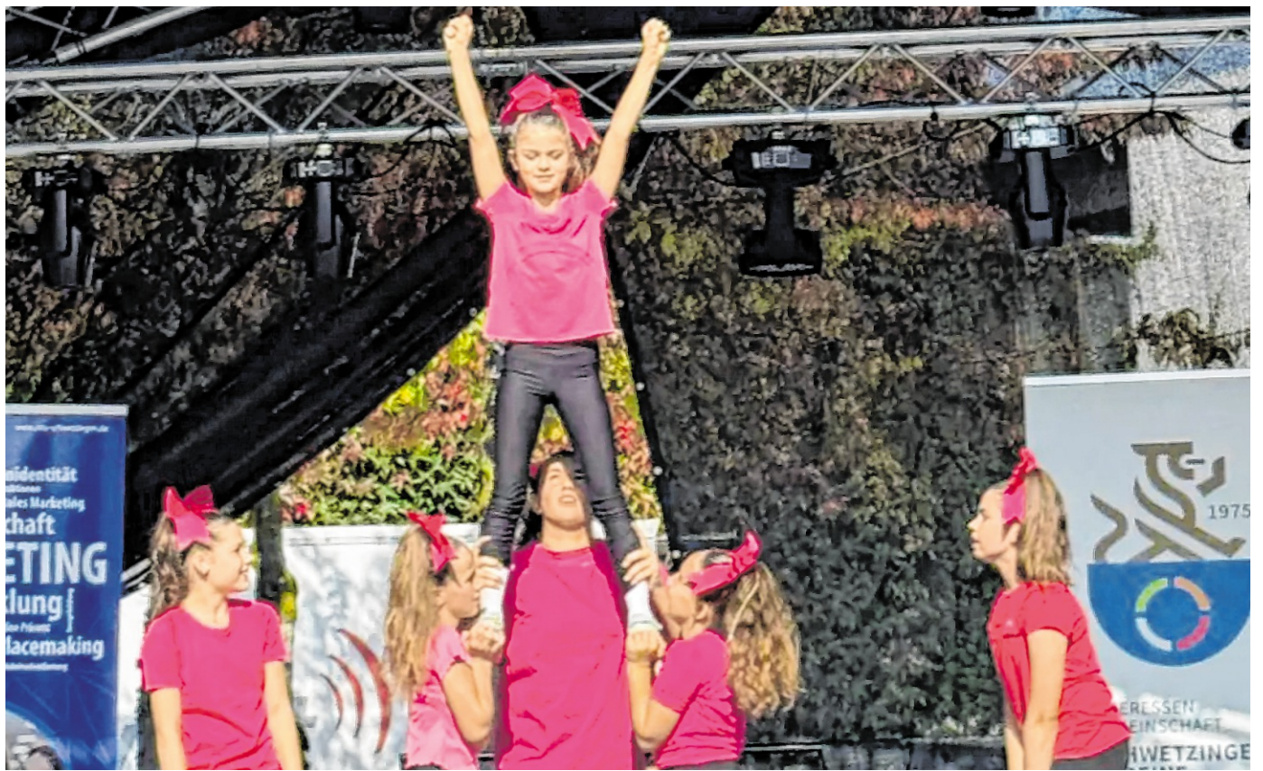
Die neue Cheerleader-Gruppe des Turnvereins.

Direkt im Anschluss blieb die Stimmung auf der Bühne in Bewegung. In einem Mitmachslot wurde der „Super Tramp Tanz“, bekannt aus der Beachvolleyball-Szene, gemeinsam präsentiert. Kinder, Jugendliche und Er-