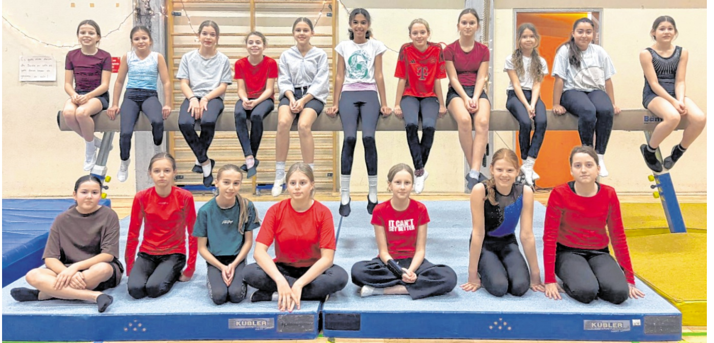
Die Weihnachtsturnschau der Fünft- und Sechstklässlerinnen.

Beim Kinderturnen ohne Begleitung im Alter von dreiein-