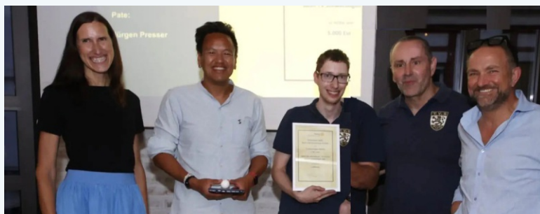
Das inklusive Tischtennis-Projekt des TV 1864 wurde mit dem Rotary-Förderpreis 2025 ausgezeichnet. Der Preis ist mit 5.000 Euro dotiert. Mit dem Projekt „Spiel, Satz und Inklusion – Tischtennis für alle sportinteressierten Menschen mit und ohne Behinderung“ hat der Verein erneut ein starkes Zeichen für seine soziale Marke „Inklusion & Integration“ gesetzt.