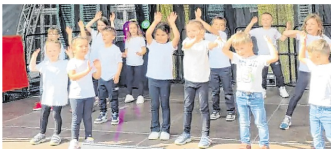
Auch die Jüngsten waren mit großem Spaß dabei.