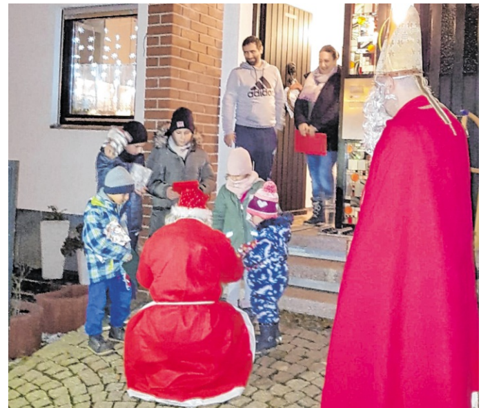
In über 100 Familien waren die neun Gruppen am Nikolaustag unterwegs.